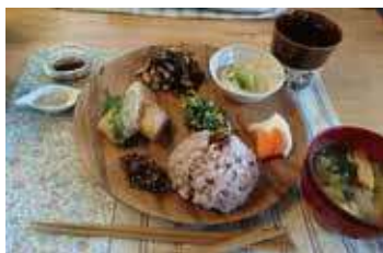
(写真はイメージです。当日のお料理と異なります)

夏から秋へと移り変わる時期の不調は実は腸が持つ働きが関係しているのです。栄養士の中村寛子先生の美腸講座です。